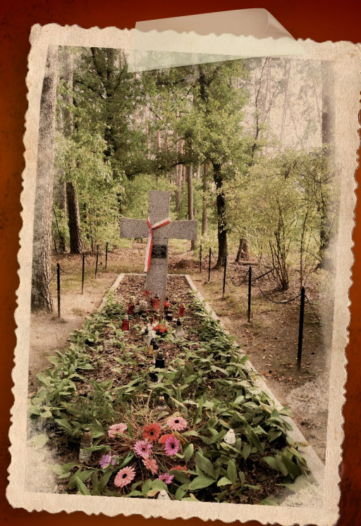
▲ Kwaterna duchownych. Las Pałędzko – Zakrzewski.

Ciała zakopywano w zbiorowych mogiłach. Miejsce tych przerażających egzekucji Niemcy wybrali nieprzypadkowo. Ten gęsty kompleks leśny znajdował się stosunkowo blisko Poznania, a w szczególności Fortu VII. Był to też las do którego już we wrześniu 1939 r. Niemcy pod groźbą śmierci zakazali wchodzić okolicznym polskim mieszkańcom. Niebagatelne znaczenie miał też fakt, że zlokalizowana blisko lasu wieś Zakrzewo w większości była zamieszкана przez Niemców. Stanowiło to naturalne zaplecze logistyczne dla tego zbrodniczego procederu. Te wszystkie okoliczności sprawiły, że to właśnie te lasy wybrało poznańskie Gestapo, a wcześniej dowódca Einsatzgruppe VI, jako miejsce masowych egzekucji polskich obywateli z terenu całej Wielkopolski. Ocenia się, że w Lasach Pałędzko – Zakrzewskich Niemcy zamordowali ok. 4500 ofiar, ale niektóre szacunki mówią nawet o kilkunastu tysiącach zamordowanych. Oszacowanie liczby ofiar nastęrcza badaczom duże trudności z uwagi na wydobycie i spalenie zwłok w 1944 r. przez specjalne niemieckie Sonderkommando Leghat, działające w ramach akcji „1005”.