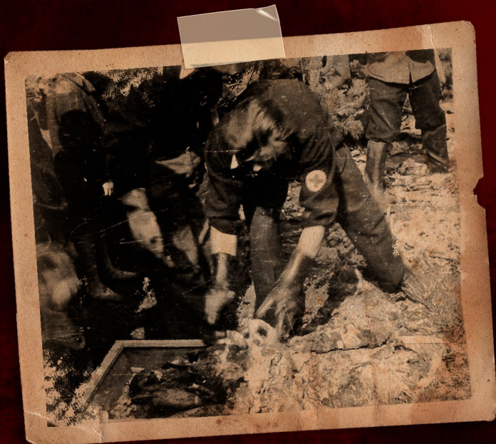
▲ Składanie wydobytych zwłok do trumny.

To kompleks leśny znajdujący się na granicy Rudy Śląskiej, Katowic i Mikołowa, w którym w 1939 r. Niemcy dokonywali tajnych egzekucji polskich obywateli pochodzących z terenu Górnego Śląska. Tajemnica tych zbrodni nie została wyjaśniona do dnia dzisiejszego, mimo przeprowadzonej po zakończeniu II wojny światowej ekshumacji ofiar oraz prowadzonego śledztwa. Zbrodnie dokonane przez Niemców na terenie Górnego Śląska w pierwszych miesiącach II wojny światowej, miały swoją specyfikę i różniły się intensywnością od stosowanych przez Niemców represji w innych regionach Polski. Dużą rolę w tych zbrodniach oprócz regularnych jednostek Wehrmachtu, a także późniejszych działań Einsatzgruppen, odegrały zorganizowane oddziały niemieckich formacji dywersyjnych znanych pod nazwą Freikorps Ebbinghaus. W dużej mierze to członkowie tych grup byli odpowiedzialni za publiczne egzekucje i samosądy na Polakach na początku września m. in. w Katowicach.