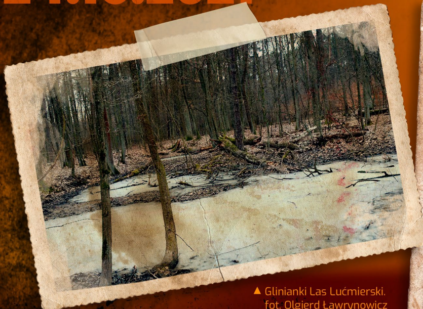
▲ Glinianki Las Łućmierski.