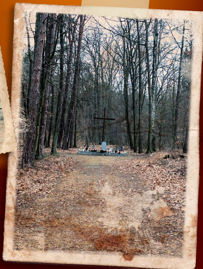
▲ Las Łućmierski.

Na ziemi łódzkiej do największych zatrzymań w ramach „Intelligenzaktion” doszło między 9 a 11 listopada 1939 r., po utworzeniu w Łodzi placówki gestapo i włączeniu miasta w granice Rzeszy, tuż przed Świętem Niepodległości. Tajna policja niemiecka osadzała aresztowanych w łódzkich więzieniach, a także m.in. w specjalnie utworzonym obozie przejściowym na Radogoszczu (fabryka Michała Glazera przy ul. Krakowskiej 55, ob. ul. Liściasta 17). W ośrodku tym, w skrajnie prymitywnych warunkach, Niemcy zgromadzili od 1500 do 2 000 osób. W toku selekcji, przeprowadzonej przez gestapo i niemieckie sądy specjalne, wyłoniono co najmniej 500 osób przeznaczonych do zagłady. Egzekucji dokonywano od 12 listopada 1939 r. do wiosny 1940 r. w podłódzkich lasach: Łućmierskim, Łągiewnickim, Wiączyńskim, Okręglik, a także na terenie poligonu wojskowego na Brusie w Łodzi. Ciała ofiar grzebano w zbiorowych mogiłach. W 1944 r. szczątki w większości zostały przez Niemców wydobyte i spalone w ramach akcji zacierania śladów zbrodni, akcja „1005”. Uniemożliwia to dokładne określenie liczby zamordowanych.