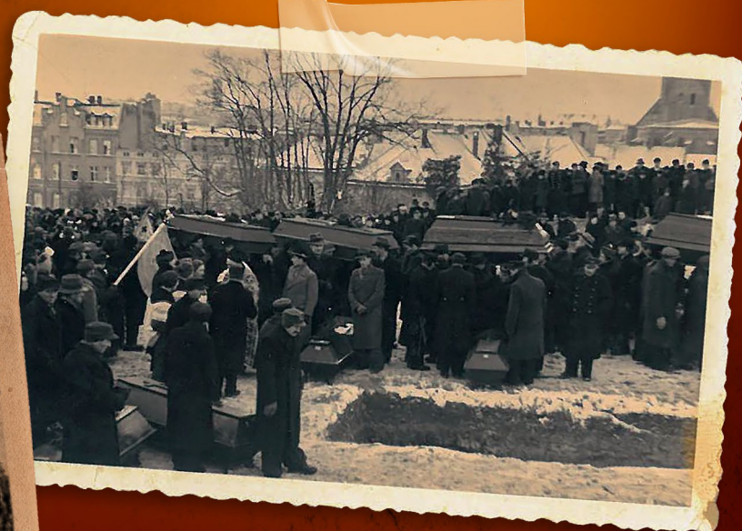
▲ Pogrzeb zamordowanych na Polach Igielskich, Chojnice 1945 r.