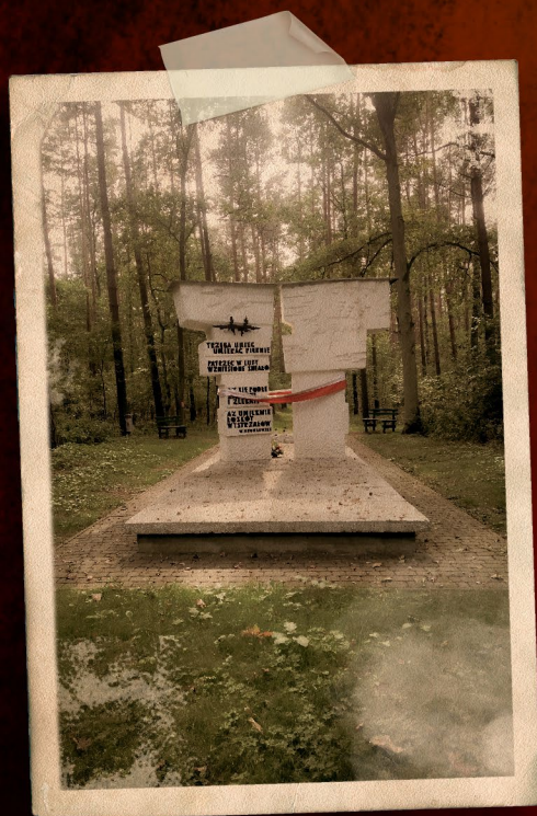
▲ Pomnik pomordowanych studentów i profesorów w Lasach Pałędzko – Zakrzewskich.

Lasy Pałędzko – Zakrzewskie to jedna z największych masowych zbrodni dokonanych przez Niemców w okresie II wojny światowej w Wielkopolsce. W tamtejszych lasach zostali przez Niemców zamordowani najwybitniejsi obywatele II Rzeczypospolitej z terenu całej Wielkopolski. Głównie byli to polscy więźniowie osadzeni w Forcie VII w Poznaniu. Zabudowania Fortu pełniły w tym czasie funkcję pierwszego niemieckiego obozu koncentracyjnego, założonego na okupowanych terenach Polski. Bezpośrednim sprawcą tych mordów była niemiecka formacja specjalnego przeznaczenia składająca się z członków Policji Bezpieczeństwa (Sipo) i Służby Bezpieczeństwa (SD) – Einsatzgruppe VI. Funkcjonariusze tej formacji przewozili tam swoje ofiary i począwszy od października 1939 r., a według niektórych źródeł już od września 1939 r., systematycznie je mordowali strzałem w tył głowy.