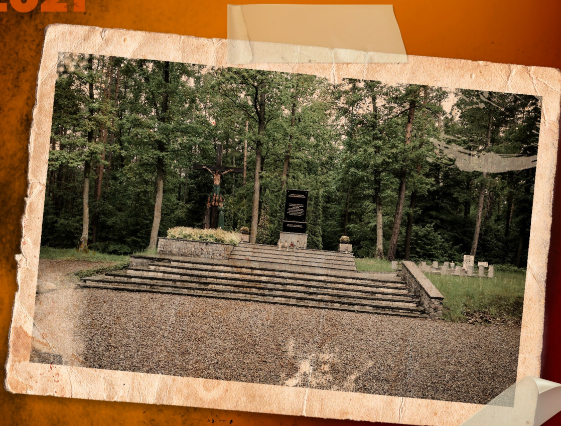
Las Szpegawski. ▶